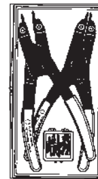
7053K Innen- und Außenring- zange, 4 Spitzen- größen

Nr. 209201 – Je ein Paar Ersatzspitzen für die Zangen Nr. 7300 und Nr. 7301. Gewicht 0,1 kg.